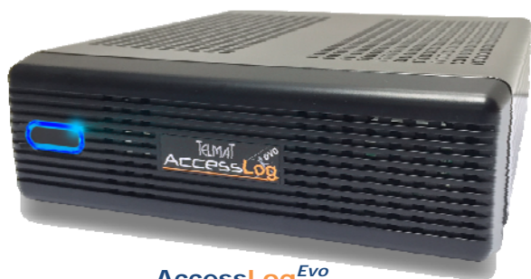
AccessLog Evo 50 à 300 connexions simultanées

Série AccessLog Evo De 50 à 300 connexions simultanées