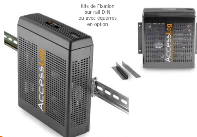
Kits de Fixation sur rail DIN ou avec équerres en option